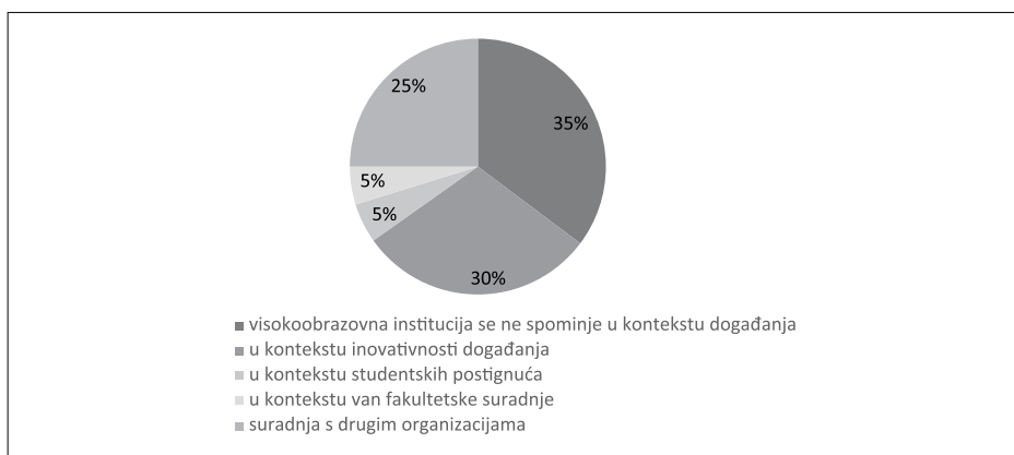
Grafikon 3. Kontekst spominjanja visokoobrazovne institucije u medijskom izvještavanju o pseudodogađaju

pseudodogađajima. No, visokoobrazovna institucija u većini analiziranih objava (13 analiziranih članaka) spominje se u kontekstu pseudodogađaja. Analiza je pokazala da kad mediji izvještavaju o visokoobrazovnoj instituciji u kontekstu pseudodogađaja, pretežno izvještavaju u kontekstu inovativnosti događanja (6 analiziranih članaka). Detaljan omjer konteksta u kojem se spominje visokoobrazovna institucija kad se izvještava o pseudodogađaju prikazan je u grafikonu 3.