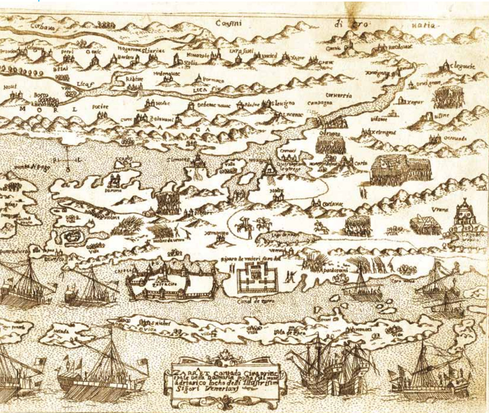
Fig. 8. Anonymous, ZARRA ET Contado Citta principale Della Dalmatia posta sul mare adriatico locho delli Illustrissimi Signori Venetianj [and Šibenik region], ZN-I-XVI-ANO-1571

Another master map maker from Northern Dalmatia contributed to the early mapping of his homeland in the medium scale. Natale Bonifacio (1537–1592) was, like Rota, a very talented and skilful copperplate artist and engraver. He spent much of his life in Venice and Rome. He was quite prolific in the production of small scale maps (including some of Africa, Congo and Scotland), larger scale editions such as city views (Naples and Paris) and a number of isolario maps. He made the famous Map of the Illyrian provinces , a series of maps representing Dalmatia, and regional maps of Abruzzi,