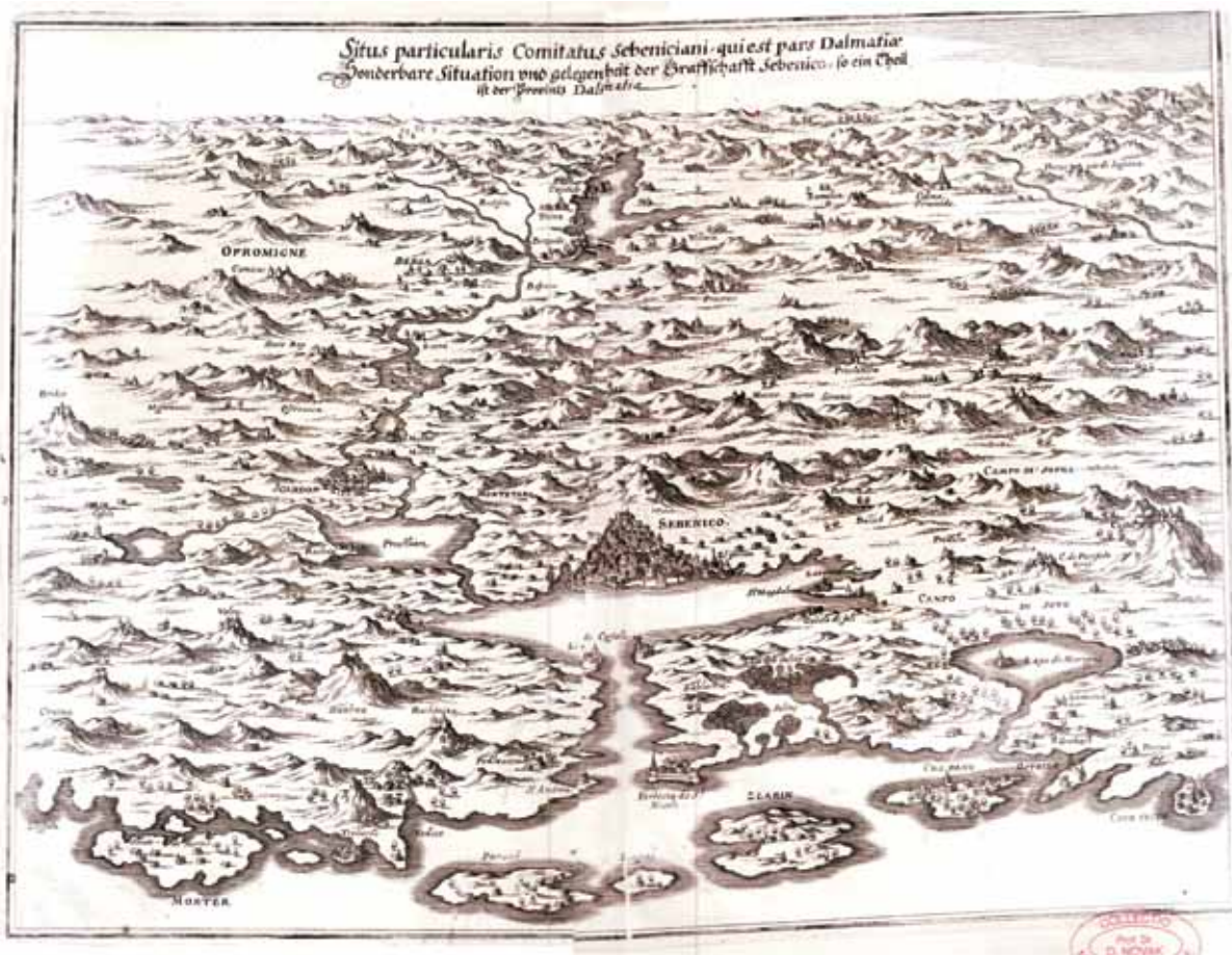
Fig. 2. Matthaeus Merian, Situs particularis Comitatus Sebeniciani, qui est pars Dalmatiae / Sonderbare Situation und gelegenheit der Graffschafft Sebenico, so ein Theil ist der Provintz Dalmatia , The Novak Collection, unsigned Slika 2. Matthaeus Merian, Situs particularis Comitatus Sebeniciani, qui est pars Dalmatiae / Sonderbare Situation und gelegenheit der Graffschafft Sebenico, so ein Theil ist der Provintz Dalmatia , Zbirka Novak, bez potpisa

dominant groups. Cartographic representations were almost always commissioned from abroad or by the ruling elite (Harley, 1988, 300-303; Black, 1997). Nonetheless, in the 16th century, cartography in general achieved interdisciplinary status, by adhering to the Renaissance path in science and art. Along with artistic and engraving skills, map production also required knowledge of geography and geodesy. Field work was a prerequisite for the successful acquisition of local data. Sketches and drawings were painstakingly collected and compiled in cartographic syntheses. Even the oldest maps of these lands (such as Ptolomeius') were predominantly regional maps of a smaller or medium scale 3 .