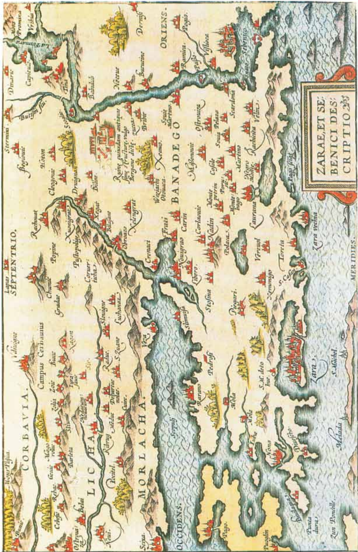
Fig. 6. Natale Bonifacio, ZARAE, ET SEBENICI DESCRIPTIO, ZN-Z-XVI- BON-1573 Slika 6. Natale Bonifacio, ZARAE, ET SEBENICI DESCRIPTIO, ZN-Z-XVI- BON-1573