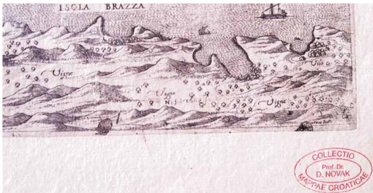
Fig. 3. Martin Rota, Panoramic view of Split and its surroundings , ZN-Z-XVI-ROT-1558/1568, detalj Slika 3. Martin Rota, panoramski prikaz Splita i okolice , ZN-Z-XVI-ROT-1558/1568, isječak