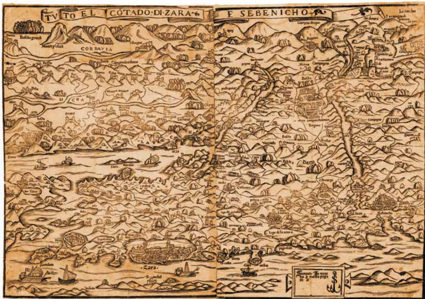
Fig. 5. Mateo Pagano, TVTO EL CÔTADO. DI. ZARA – E SEBENICHO, ZN-Z-XVI-PAG-1530

Slika 5. Mateo Pagano, TVTO EL CÔTADO. DI. ZARA – E SEBENICHO, ZN-Z-XVI-PAG-1530