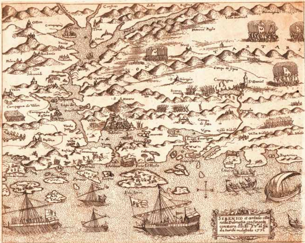
Fig. 7. Camocio, SEBENICO ET contado citta nella Dalmatia confina[n]te con Zarra d[el]li Ill[ustriss]mi S[igno]ri Ven[ezia]ni al p[rese]nte da Turchi molestado: 1571, ZN-I-XVI- CAM-1571-5