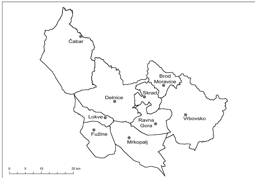
Figure 1: Territorial-administrative division of Gorski Kotar and major centres