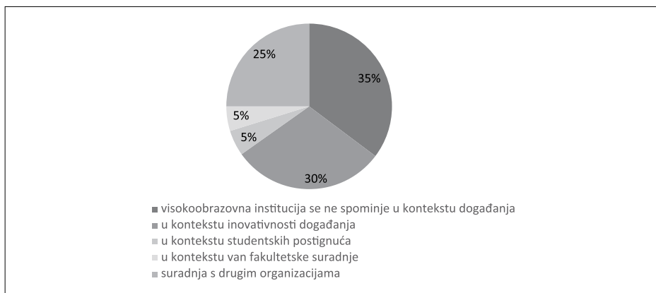
Grafikon 3. Kontekst spominjanja visokoobrazovne institucije u medijskom izvještavanju o pseudodogađaju

pseudodogađajima. No, visokoobrazovna institucija u većini analiziranih objava (13 analiziranih članaka) spominje se u kontekstu pseudodogađaja. Analiza je pokazala da kad mediji izvještavaju o visokoobrazovnoj instituciji u kontekstu pseudodogađaja, pretežno izvještavaju u kontekstu inovativnosti događanja (6 analiziranih članaka). Detaljan omjer konteksta u kojem se spominje visokoobrazovna institucija kad se izvještava o pseudodogađaju prikazan je u grafikonu 3.