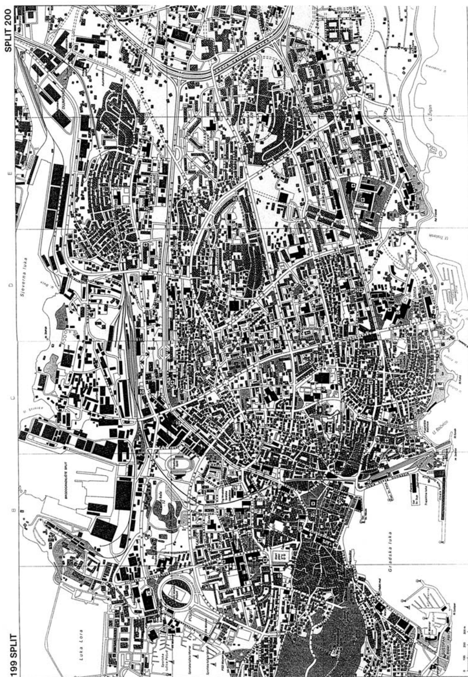
Sl. 2. Izvadak iz plana grada Splita