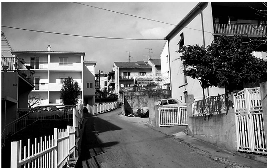
Sl. 4. Visoka-primjer stambenog naselja individualne izgradnje Fig. 4 Visoka - example of the individual construction housing estate

Brda su stambena jedinica na sjevernoj strani Splitskog poluotoka, neposredno uz Sjevernu luku. Izgradnja naselja je počela 1950-ih godina nakon izgradnje željezničkog tunela, a do tada je bilo izgrađeno samo pedesetak kuća. Veći dio naselja čine obiteljske kuće koje su u početku bile bespravno sagrađene, ali su kasnije legalizirane. Godinama je bilo prilično izolirano naselje, na periferiji grada i pripadalo naseljima lošijeg životnog standarda. Krajem 1960-ih izgrađeno je nekoliko stambenih zgrada. Stambena jedinica Kman jedno je od najstarijih naselja poslijeratne individualne izgradnje, u početku većim dijelom nekontrolirane. Visoka je naselje individualne stambene izgradnje, na uzvisini Visoke nastalo 1960-ih godina najvećim dijelom nekontroliranom izgradnjom. Danas je samo jedan manji dio objekata bez građevinskih dozvola. Većinu stanovnika čine doseljenici iz Zagore i primjer je naselja nastalog kao posljedica intenzivne imigracije u Split.