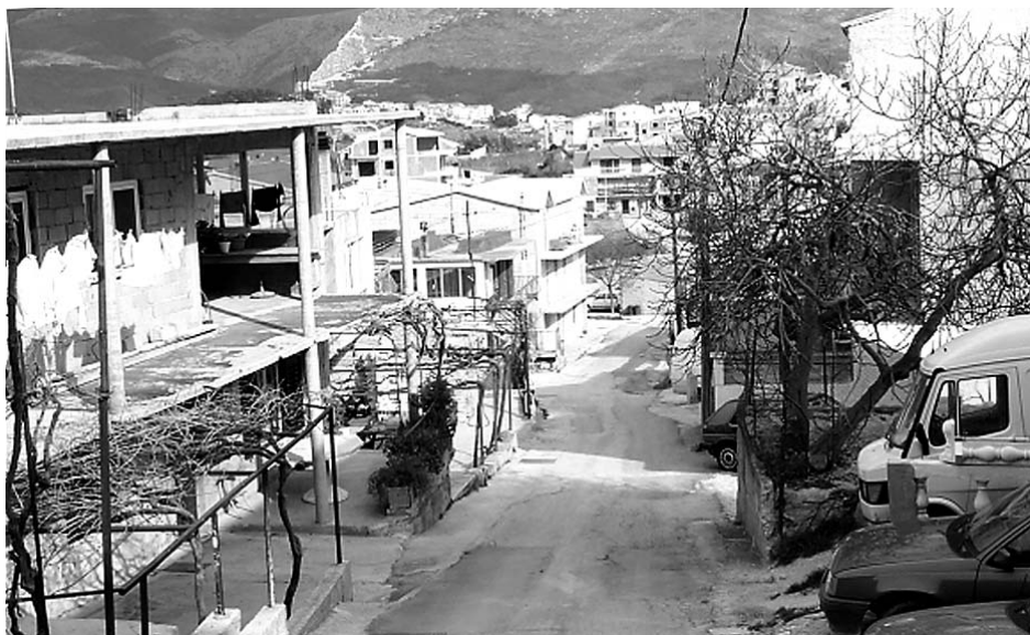
Sl. 5. Sirobuja-primjer stambenog naselja nekontrolirane izgradnje Fig. 5 Sirobuja –example of the uncontrolled construction housing estate

Primjer nekontroliranog naselja na području grada Splita je Sirobuja , koja se nalazi između groblja Lovrinac i Stobreča. Naselje ima nekoliko tisuća stanovnika i oko tisuću kuća