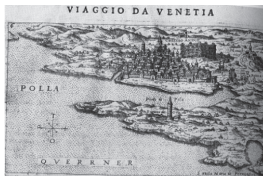
Slika br. 2 Prikaz Pule s okolicom iz izolar: Viaggio da Venetia a Constantinopoli . G. Rosaccio, 1606. Collectio Novak, ZN-I-XVII-ROS-1605-3

Neka funkcionalno-morfološka obilježja krajolika, bilo aktualnoga ili prošlog, čitljiva su iz geografske toponimije, koja uključuju i semantičko značenje i etimološku razinu pojma. Etimologija toponima omogućuju svojevrsnu jezičnu rekonstrukciju geografsko-ekološkog ambijenta u vrijeme nastajanja geografskih imena. Za analizu povijesnog rasprostiranja endemičnih bolesti važni su i fitotoponimi te ornitotoponimi 14 , proizašli iz imena biljaka i ptica prilagođenih vlažnom i