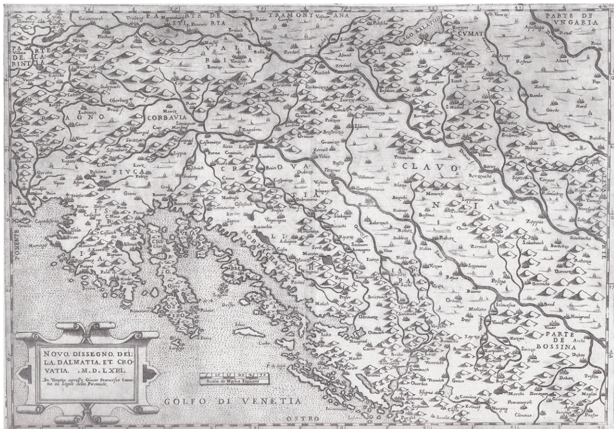
Slika 3. Novo dissegno della Dalmatia et Crovattia Francesca Camocija, 1563. (Lago, 1998.)

Figure 3 Novo dissegno della Dalmatia et Crovattia by Francesco Camocio, 1563 (LAGO, 1998)