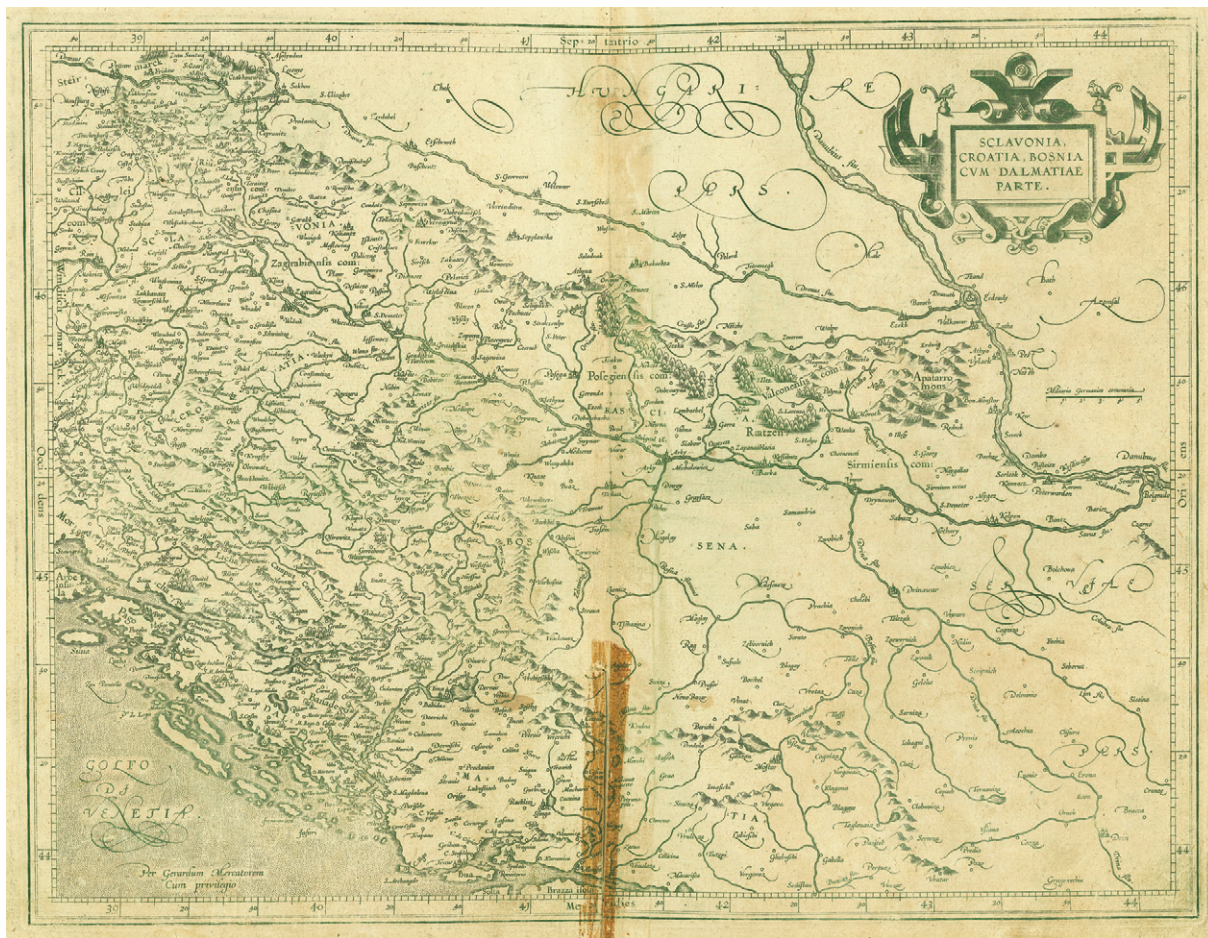
Slika 6. Mercatorova karta Slavonia, Croatia, Bosnia cum Dalmatiae Parte, 1589. (Državni arhiv u Zadru, Knjižnica, sign. II. a. 4)

Figure 6 Mercator's map Slavonia, Croatia, Bosnia cum Dalmatiae Parte , 1589 (National Archives in Zadar, Library, sign. II. a. 4)