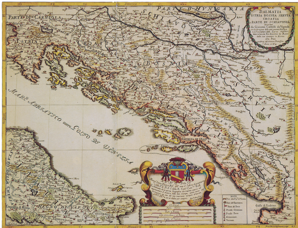
Slika 11. Cantellijeva karta Hrvatske i susjednih zemalja, 1684. (MARKOVIĆ, 1993.) Figure 11 Cantelli's map of Croatia and adjacent lands, 1684 (MARKOVIĆ, 1993)

Jadrana (Golfo di Venezia), istočne obale Jadrana ( Ristretto della Dalmazia Diuisa ne Suoi Contadi ) i Podunavlja ( Corso del Danubio da Vienna Sin' à Nicopoli e Paesi Adiacenti ). Coronellijevu su geografsku građu o Hrvatskoj preuzimali brojni europski kartografi (npr. J. B. Nolin, N. Sanson, J. B. Homann, M. Seutter, R. i J. Ottens i dr.) pa je ona umjesto Lučićeve i Cantellijeve građe činila osnovu geografsko-kartografske percepcije Hrvatske u Europi tijekom većeg dijela 18. st.