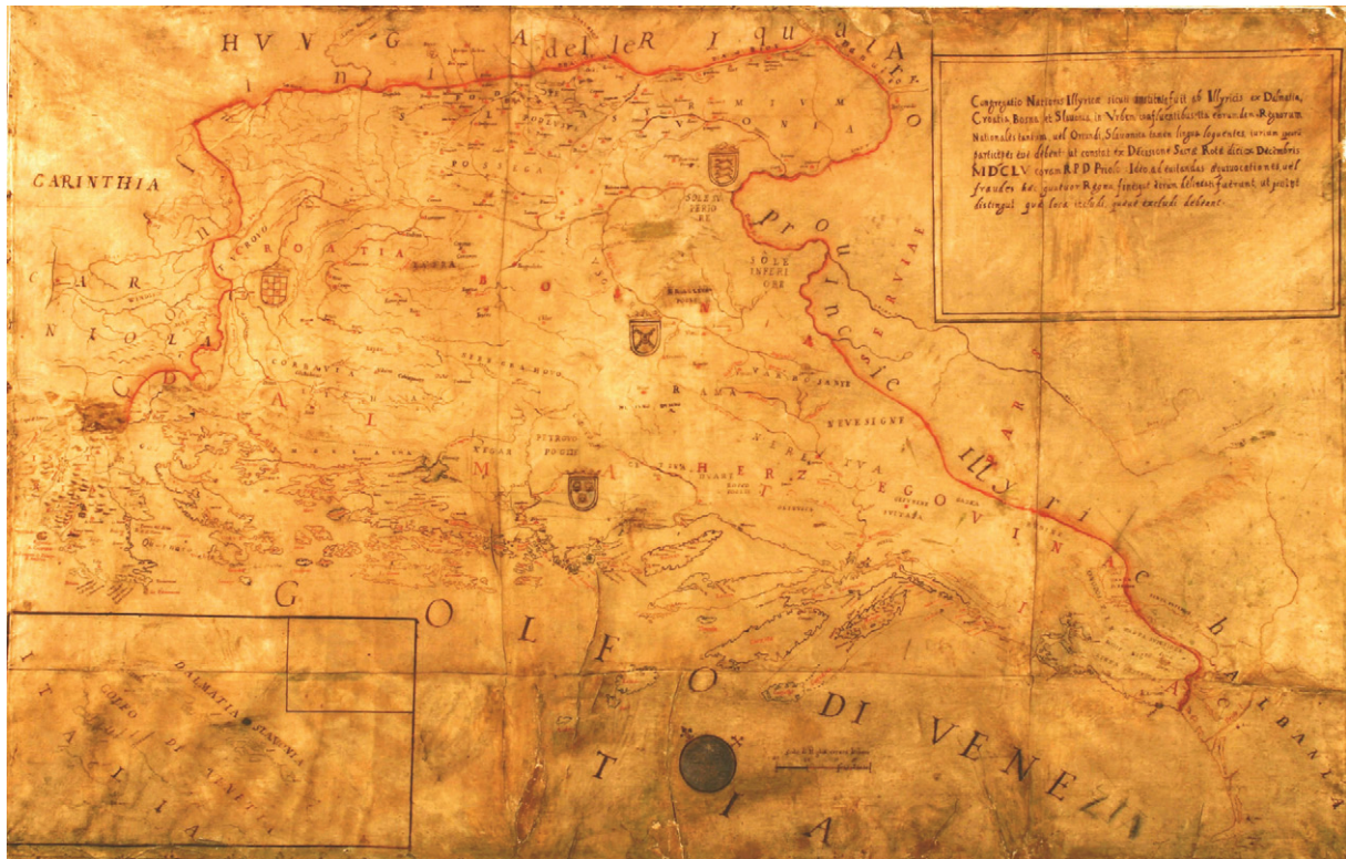
Slika 8. Rukopisna karta hrvatskih zemalja izrađena za potrebe Papinskog zavoda sv. Jeronima, 1663. (Papinski zavod sv. Jeronima, Rim)

Figure 8 Manuscript map of the Croatian lands made for the purposes of the Papal Congregation of St. Jerome, 1663 (Papal College of St. of Jerome, Rome)