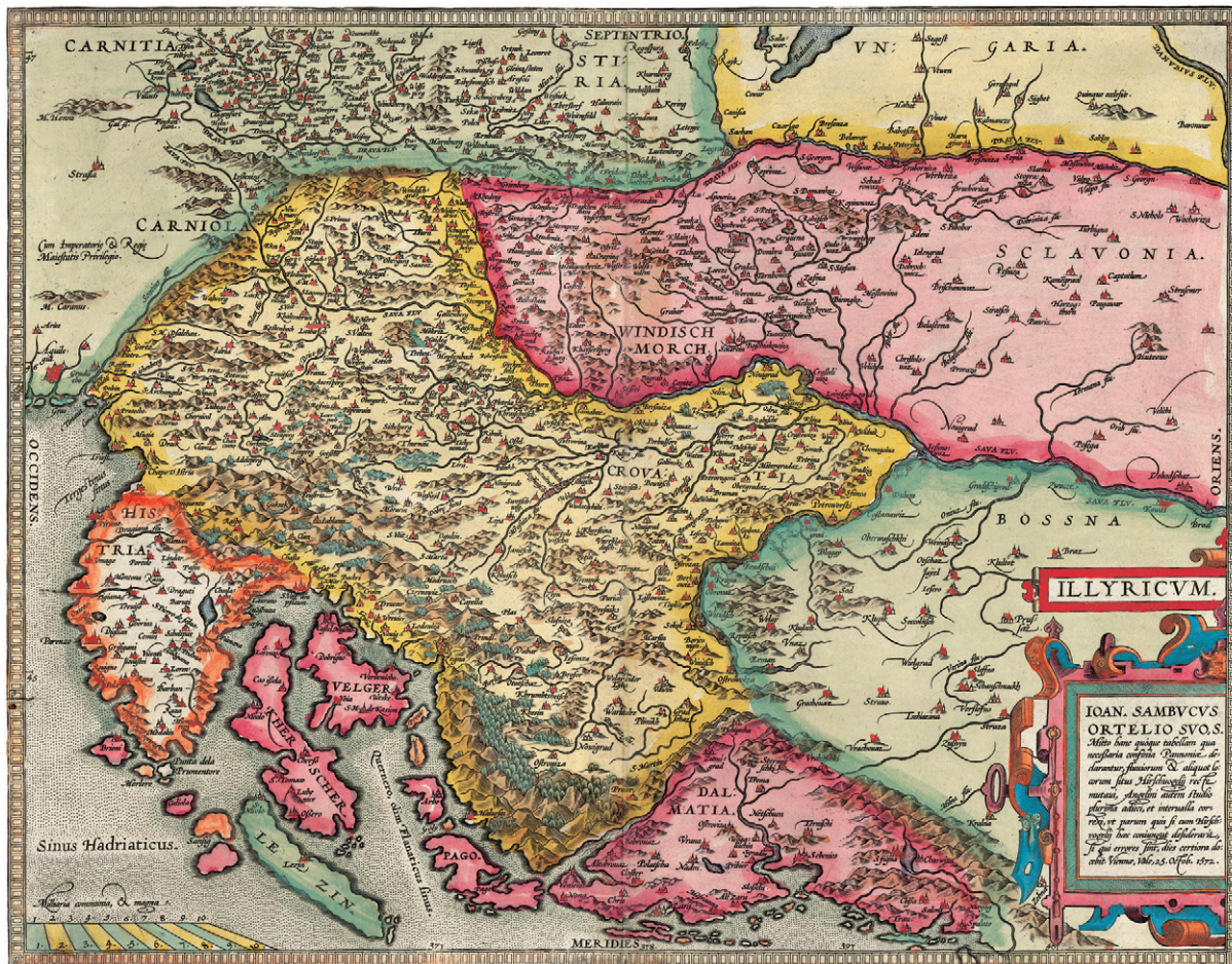
Slika 4. Sambucusova karta Ilirika, 1572. (Zbirka Novak, sign. ZN-Z-XVI-SAM-1572a) Figure 4 Sambucus' map of Illyria, 1572 (Novak Collection, sign. ZN-Z-XVI-SAM-1572a)

Boreali koju je Jan Jansson objavio u zbirci Atlas Maritimus, Seatlas oder 'Wasserwelt unutar atlasa Atlas novus (Amsterdam, 1650.) i karta Tafel der Stätte und Herschaften Zara und Sebenico in Dalmatia gelegen, allwo die Venediger dem Türckhen unterschiedliche veste Örther abgenom(m)en in Jahr 1646. und 47 koju je objavio Matthaeus Merian 1647. u djelu Theatri Europaei (Frankfurt, 1647.; KOZLIČIĆ, 1995.; MLINARIĆ, 2011.).