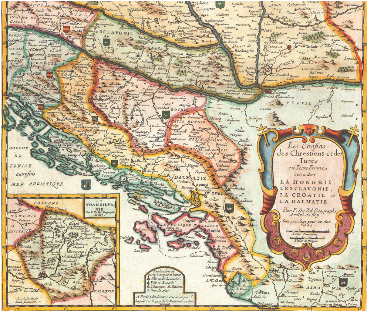
Slika 7. Duvalov prikaz Hrvatske na karti kršćansko-osmanlijskog ratišta, 1663. (Zbirka Novak, sign. ZN-Z-XVII-DUV-1663)

Figure 7 Duval's depiction of Croatia in his map of the Christian-Ottoman war zone, 1663 (Novak Collection, sign. ZN-Z-XVII-DUV-1663)