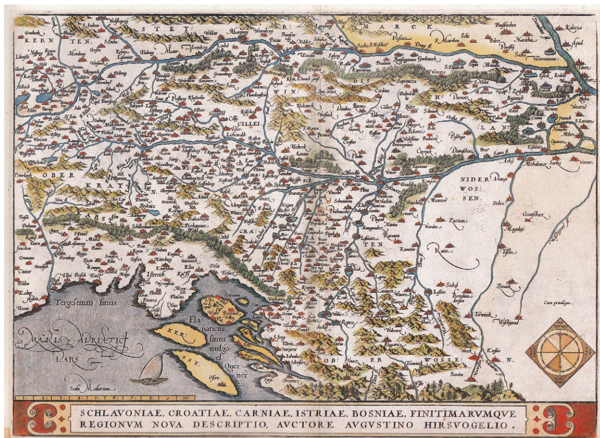
Slika 5. Hirschvogelov prikaz Hrvatske na karti Schlavoniae, Croatiae, Carniae, Istriae, Bosniae finitimarvmque regionvm nova descriptio , 1570. (Zbirka Novak, sign. ZN-Z-XVI-HIR-1573a)

Figure 5 Hirschvogel's depiction of Croatia on the map Schlavoniae, Croatiae, Carniae, Istriae, Bosniae finitimarvmque regionvm nova descriptio , 1570 (Novak Collection, sign. ZN-Z-XVI-HIR-1573a)