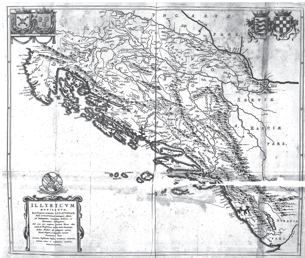
Slika 9. Lučićeva karta današnjeg Ilirika, objavljena u: I. Lučić, De Regno Dalmatiae et Croatiae , 1668. (Nacionalna i sveučilišna knjižnica, sign. R-II-F-4o-46/a)

Figure 9 Lučić's map of present-day Illyria, published in: I. Lučić, De Regno Dalmatiae et Croatiae , 1668 (National and University Library in Zagreb, sign. R-II-F-4o-46/a)