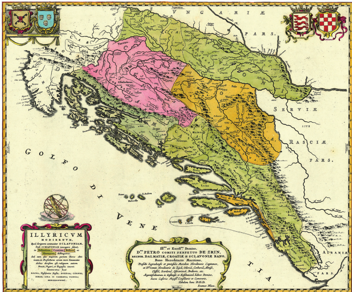
Slika 10. Lučićeva karta Današnjeg Ilirika, objavljena u: J. Blaeu, Atlas Maior , 1669. (Zbirka Novak, sign. ZN-Z-XVII-BLA-1669)

Figure 10 Lučić's map of present-day Illyria, published in: J. Blaeu, Atlas Maior , 1669 (Novak Collection, sign. ZN-Z-XVII-BLAH-1669)