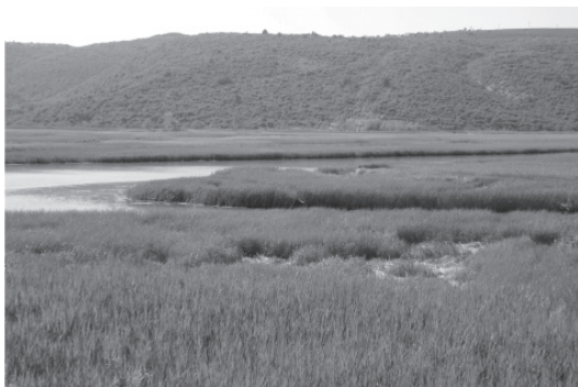
Slika br. 3 Dolina Mirne

morske luke. 21 U svezi s pojavom »malog ledenog doba« između 14. i 17. stoljeća, u nekim je krajevima došlo do pomicanja riječnih slivova, kolebanja razine jezera, njihove ekološke hipertrofije i purifikacije. 22 Takve su anomalije izazvale pojavu mikroklimatskih oscilacija, poput hladnih intervala usred ljeta, poplava i suša, što je uz prirodne nepogode, poput potresa 23 , izazivalo propast uroda i pojavu gladi.