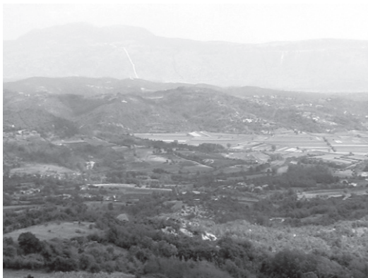
Slika br.1 Pićanska polja

naselja akropolskog tipa smještaju na uzvisinama, glavna su polja u podnožju, upravo u prostoru hidrološkog obilja ili oscilacija (Sl. 1.). Upravo su ti hidrološki objekti (potoci, jaruge, polja) i glavna žarišta endemičnih bolesti. Utjecaj je močvara u Istri zbog njihova malog broja bio neznatan. Utvrđena je i korelacija nastanka bolesti s malom nadmorskom visinom 12 na kontaktima propusnih i nepropusnih slojeva u kršu i zadržavanjem voda na području Puljštine (Sl. 2.), Poreštine, Bujštine, Čepičkog jezera i doline Mirne. Još je u 19. stoljeću Schiavuzzi prostore na slojevima gline, na nadmorskoj visini ispod 200 m n.v., koji su rijetko naseljeni i obiluju vodotocima, odnosno vlažnim tlom, prepoznao kao pogodne za razvoj malarije. Pritom je malaričnost bila obrnuto recipročna naseljenosti, odnosno obrađenosti terena. Posebno su »opasni« za širenje malarije bili gusti šumarci sa slabom cirkulacijom zraka i malim amplitudama temperature te krajevi s ispodprosječno malo padalina u 2. i 3. trimestru, malim fluktuacijama temperature te s maksimumom od 11° do 18°C između ožujka i listopada te minimumom od 5° do 11°C u istom razdoblju. 13